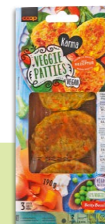
Karma Veggie Patties Meilleur du test Galette de légumes

CONTRE: Cela reste un produit ultra-transformé à consommer à l'occasion