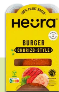
Heura Burger Chorizo Style Meilleur du test Burger végétarien

Les résultats sont assez décevants, surtout pour les burgers: dans cette catégorie, seuls 2 produits obtiennent un bon score: Heura Chorizo Style et Coop Delicorn, burger BBQ. Les pâtés de légumes font globalement mieux: peu ou pas d'additifs, moins artificiels, nous retiendrons Migros V-Love, Coop Karma et Vemondo de Lidl.