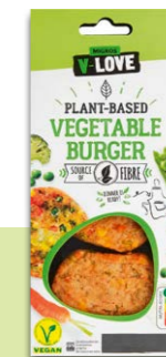
V-LOVE Vegetable Burger Meilleur du test Galette de légumes

CONTRE: Pas de supplémentation en fer et vitamine B12 pour les vegans